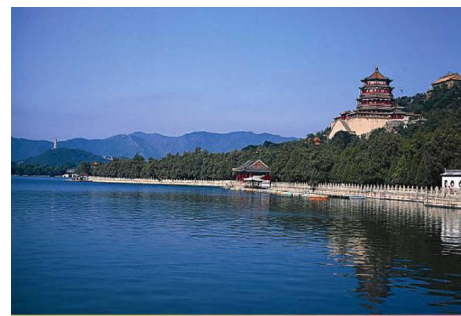
The Summer Palace